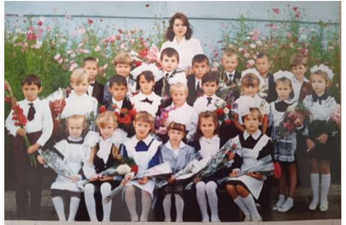
1995 г. СОШ № 62 г. Чебоксары