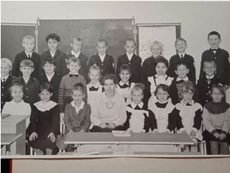
1993 г. СОШ № 62 г. Чебоксары